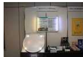
・NECライティング株式会社