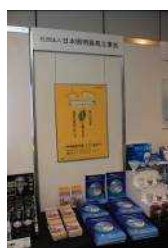
・日本照明器具工業会