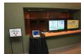
・フォーラムWeb、 しんきゅうさん体験コーナー