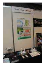
・日立ライティング株式会社