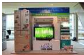
・シャープ株式会社