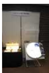
・パナソニック電工株式会社