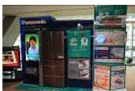
・パナソニック株式会社