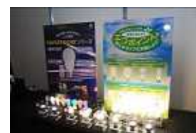
・三菱電機オスラム株式会社