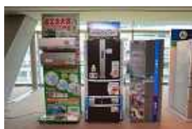
・東芝キャリア株式会社 ・東芝ホームアプライアンス株式会社