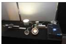
・三菱電機照明株式会社