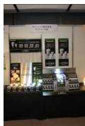
・パナソニック株式会社 ライティング社