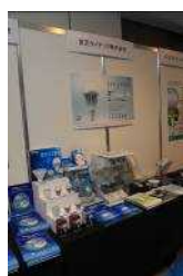
・東芝ライテック株式会社