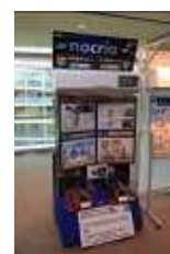
・ダイキン工業株式会社