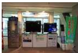
・三菱電機株式会社