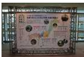
・省エネ出前授業実施学校パネル